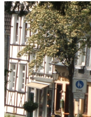
Altstadt in Essen-Werden