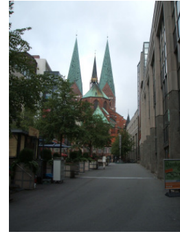
Lübecks schöne Altstadt – mit viel Beton auf dem Boden

Zur Website „Mitten in Lübeck“ Mehr zum Verfahren „Perspektivenwerkstatt“