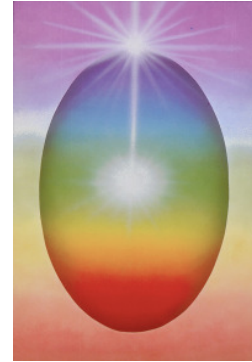
Das Psychothese-Ei: Modell des Bewusstseins nach Roberto Assagioli

Allgemeine Informationen zur Psychothese