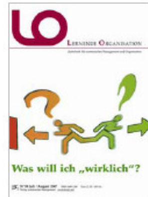
Die aktuelle Ausgabe von LO – Lernende Organisation

Die Zeitschrift LO – Lernende Organisation ist eine Zeitschrift für systemisches Management, die sich 6mal pro Jahr mit zukunftsweisenden Themen aus dem Bereich des Organisationslernens beschäftigt. Das neue Heft widmet sich der Frage: Was will ich wirklich?