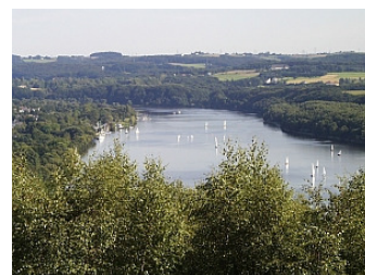
Der Baldeneysee in Essen-Werden

Dieses Seminar wendet sich an einen kleinen Kreis weiblicher Führungskräfte. Es unterstützt Frauen dabei, ihr eigenes Verständnis von Führung und Karriere herauszuarbeiten. Ziel ist eine erfolgreiche Positionierung in einem meist männlich geprägtes Arbeitsumfeld, die es Frauen erlaubt, ihre spezifischen Erfahrungen und Sichtweisen im beruflichen und privaten Alltag stärker zum Ausdruck zu bringen.