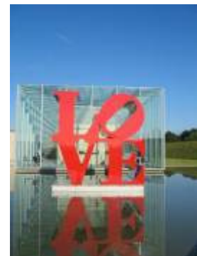
Langen Foundation bei der Raketenstation