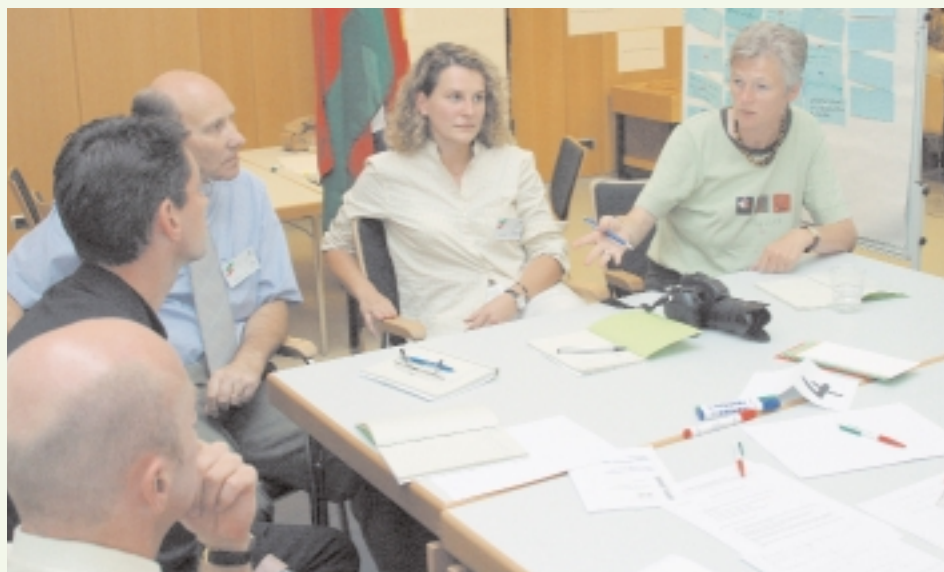
Die Teilnehmerinnen und Teilnehmer erarbeiteten rund 70 Empfehlungen für erfolgversprechende Verbesserungen in der täglichen Zusammenarbeit.