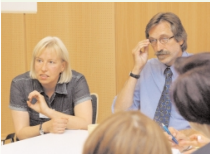
Frauen und Männer in der Polizei – geht das?

Unterschiedliche Werteverständnisse und der tägliche Umgang miteinander werden analysiert und diskutiert.