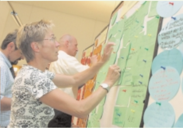
Die ersten Ergebnisse liegen vor.

Die einzelnen Diskussionsgruppen sammeln die Themen für das Plenum.