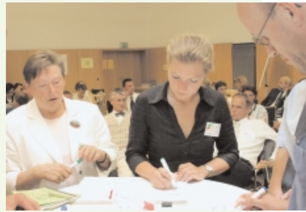
Eine der zahlreichen Ideen.

Die einzelnen Diskussionsgruppen sammeln die Themen für das Plenum.