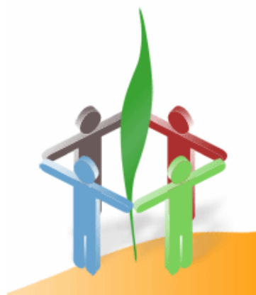
Neue Schulen braucht das Land e.V.