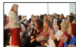
Dialog mit dem Publikum