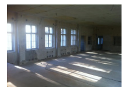
Die ehemalige Mensa