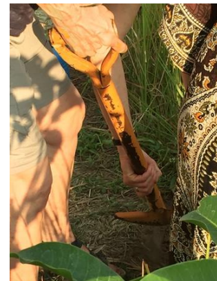
Baumpflanzen im Mindfulness Projekt