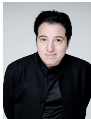
Ariane Matiakh Fazıl Say / Klavier Rundfunk-Sinfonieorchester Berlin

Felix Mendelssohn Bartholdy Sinfonie Nr. 4 A-Dur op. 90 ("Italienische") Fazıl Say "Water" (Su) - Konzert für Klavier und Orchester Richard Strauss "Aus Italien" - Tondichtung für großes Orchester op. 16