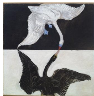
Hilma Af Klingt