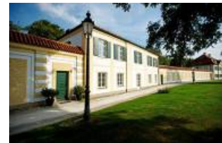
Schweisfurth Stiftung München