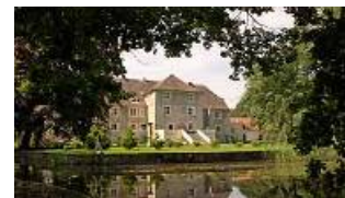
Schloss Mellentin Usedom